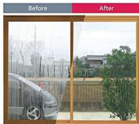
毎朝結露で びっしょり

結露も減ってすっきり! 内窓をつければ冬でも窓が冷えにくく、 結露の発生が抑えられます。