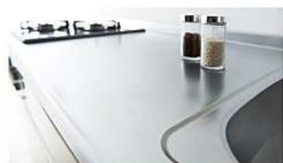
ステンレスワークトップ