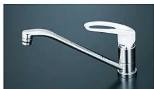
混合水栓 (泡沫吐水)